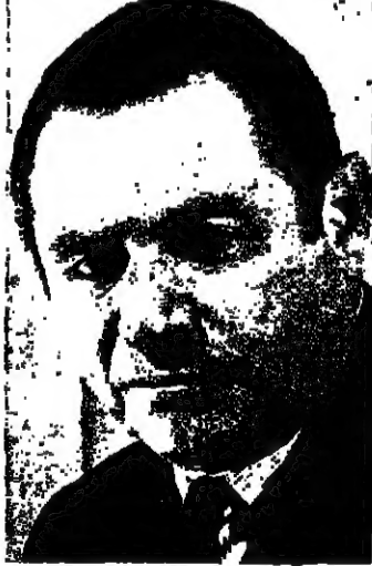
وزير الصحة السيد شوستاك في محاضرة في نادي روتري القاصرة اليلية الماضية

القاهرة - من شريف محمد - استضاف نادي روتري القاصرة اليلية الماضية وزير الصحة السيد العيوز شوستاك الذي حضر في محاضرة عن قانون التأمين الصحي الذي وضع على مائدة ابحاث الحكومة . وشارك في هذا النداء نوابي روتري العفولة ، عكا ونادي الرامة الجديد .